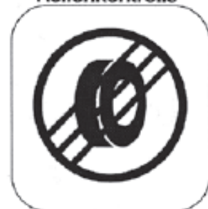
Ende der Reifenmarkierung / Reifenkontrolle