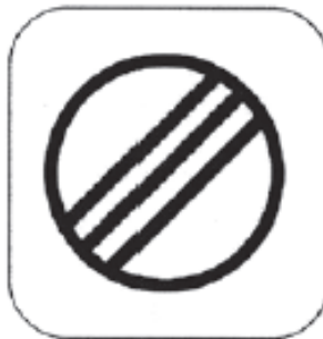
Ende der Kontrollzone