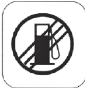
Ende der Tankzone