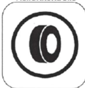
Anfang der Reifenmarkierung / Reifenkontrolle

Farbe Hinweis auf Posten: GELB Farbe Kontrollposten: BLAU