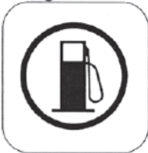
Anfang der Tankzone

Farbe Anfang der Kontrollzone: GELB Farbe Kontrollposten: ROT